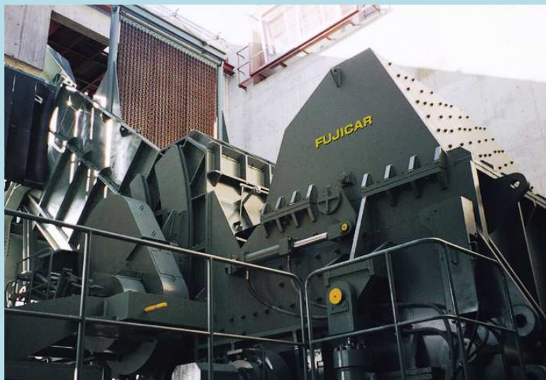
1250 馬力 シュレディングプラント(破碎機)

鉄鋼構造物から廃自動車・廃棄物まで、 さまざまな材料に対応した丸栄の大型処理設備。