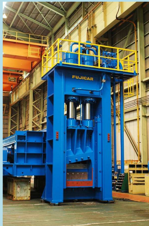
1250TON スクラップ プレス シャー(切断機)

通称ギロチン。 1250ton もの強大な油圧力で鉄 骨などハードなスクラップをま さに一刀両断に切断。材料をプ レスしてかさ比重 UP の機能も あります。