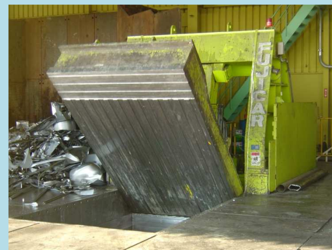
スクラップ ベーリング プレス(圧縮機)

通称プレス 新断スクラップのよう な工場発生スクラップ、 ドラム缶などの薄板材 料をサイコロ状に成形 して輸送効率 UP を図 ります。丸栄のプレス機 は特許取得の安全機構 を備えています。