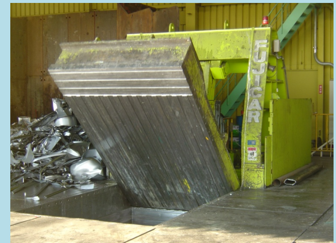
スクラップ ベーリング プレス(圧縮機)

通称プレス 新断スクラップのよう な工場発生スクラップ、 ドラム缶などの薄板材 料をサイコロ状に成形 して輸送効率 UP を図 ります。丸栄のプレス機 は特許取得の安全機構 を備えています。