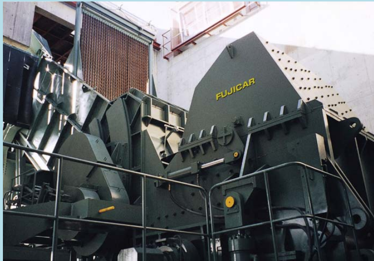
1250 馬力 シュレディングプラント(破碎機)

鉄鋼構造物から廃自動車・廃棄物まで、 さまざまな材料に対応した丸栄の大型処理設備。