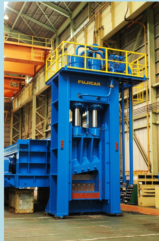
1250TON スクラップ プレス シャー(切断機)

通称ギロチン。 1250ton もの強大な油圧力で鉄 骨などハードなスクラップをま さに一刀両断に切断。材料をプ レスしてかさ比重 UP の機能も あります。